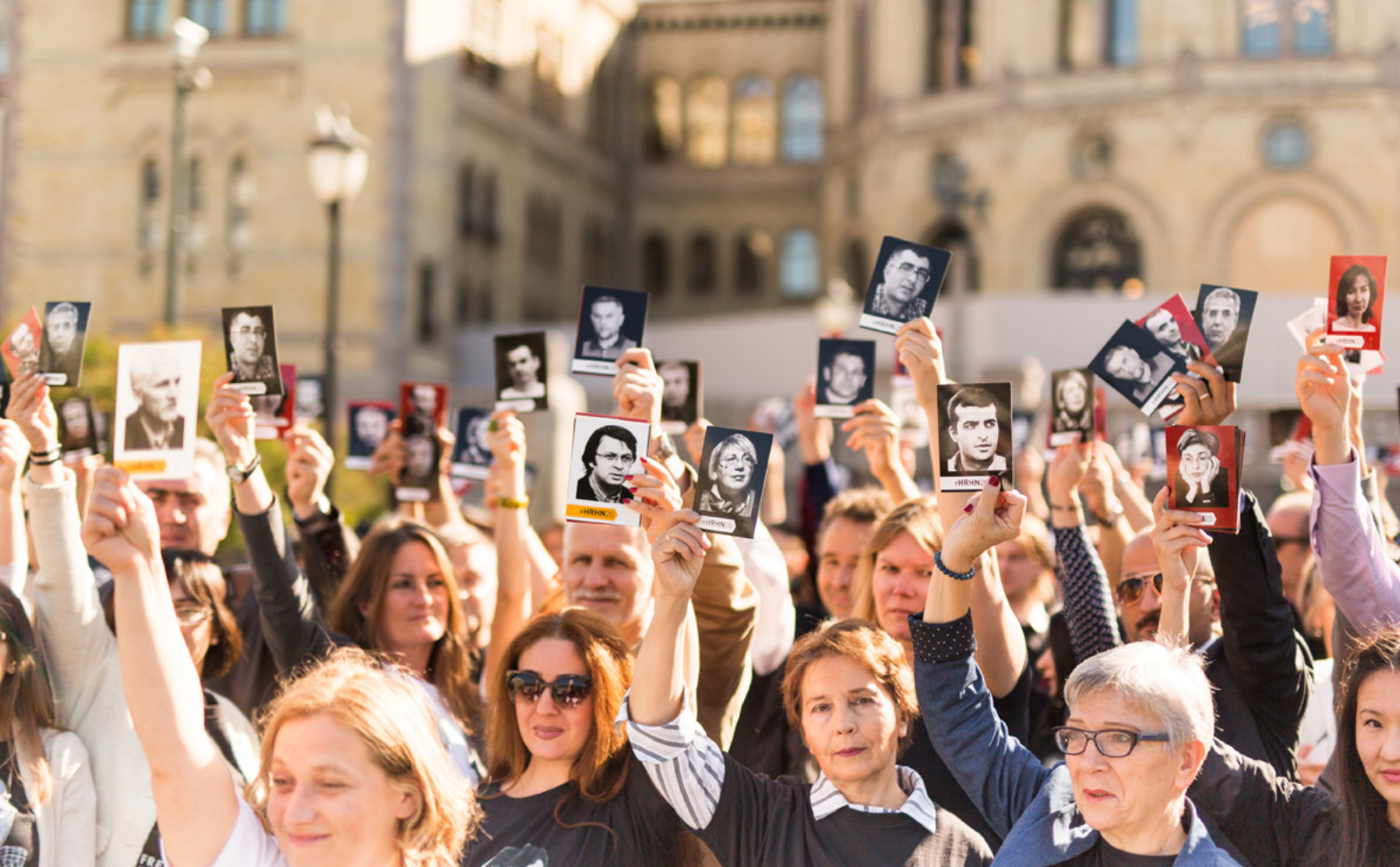
Foto: Uquq qoruyıcılar – İnsan aqları Evlerniñ temlicileri Oslo şeerindeki toplaşuvda.

diger bu neşirniñ munderecesinde olğan ve standartlarda añlatılğan ve incelenen meseleler.