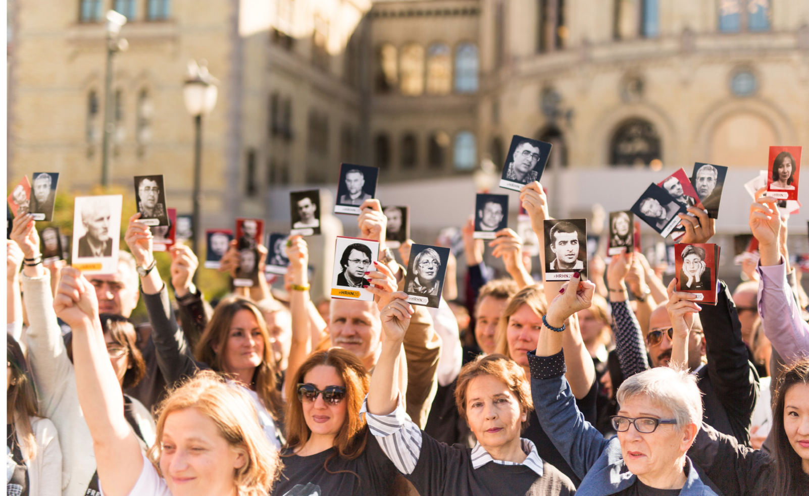
Fotografija: Branitelji ljudskih prava mreže Kuća ljudskih prava okupljeni u Oslu

Pravo da se djeluje kao branitelj ljudskih prava podrazumijeva neometano djelovanje na zaštitu i promociju ljudskih prava koje je po potrebi zaštićeno i nacionalnim zakonodavstvom. To pravo također podrazumijeva rad na svim ljudskim pravima i pravo na izbor metode rada, bilo da se radi o zagovaranju za ljudska prava mirnim prosvjedima ili putem