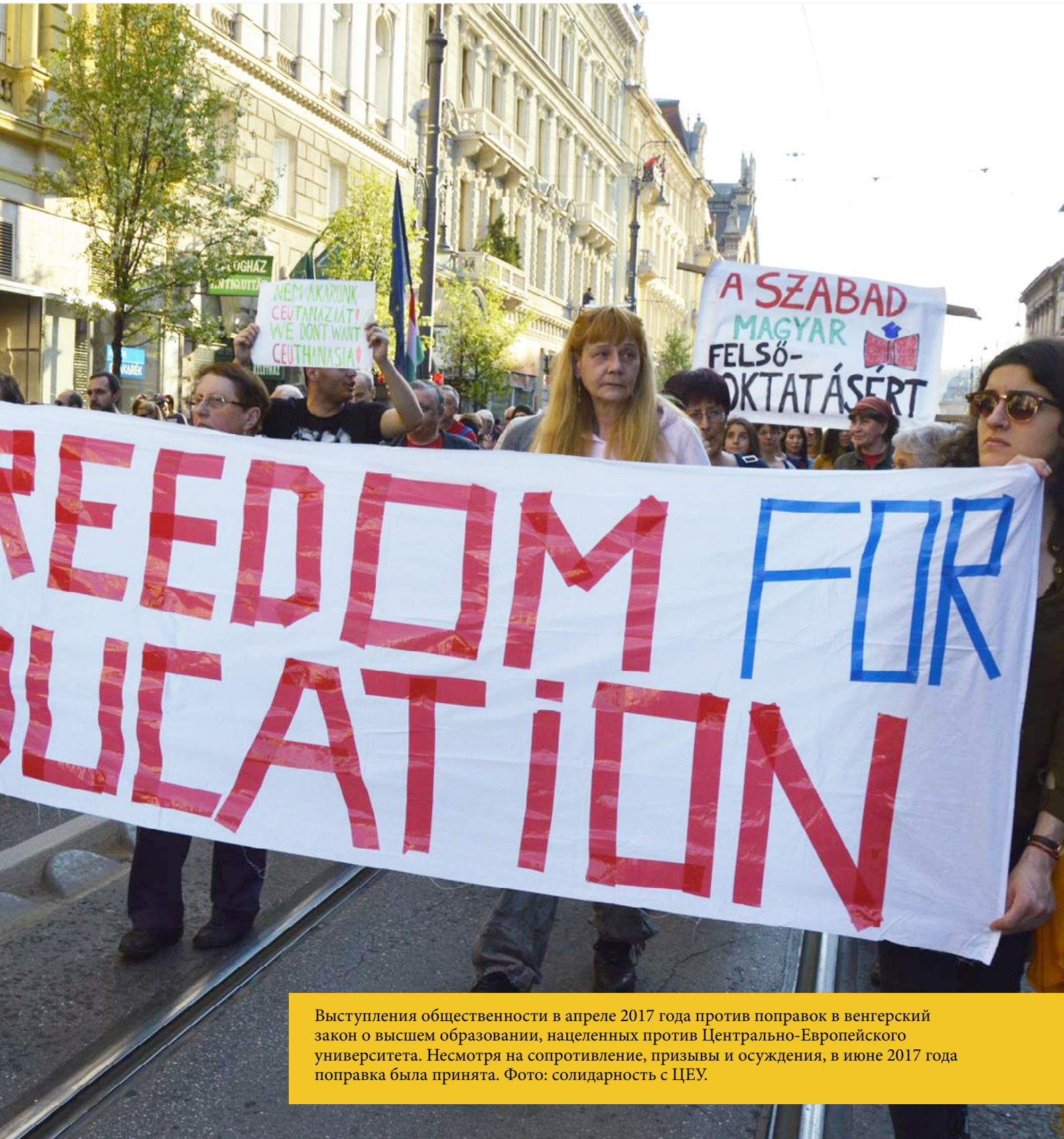
Выступления общественности в апреле 2017 года против поправок в венгерский закон о высшем образовании, нацеленных против Центрально-Европейского университета. Несмотря на сопротивление, призывы и осуждения, в июне 2017 года поправка была принята. Фото: солидарность с ЦЕУ.