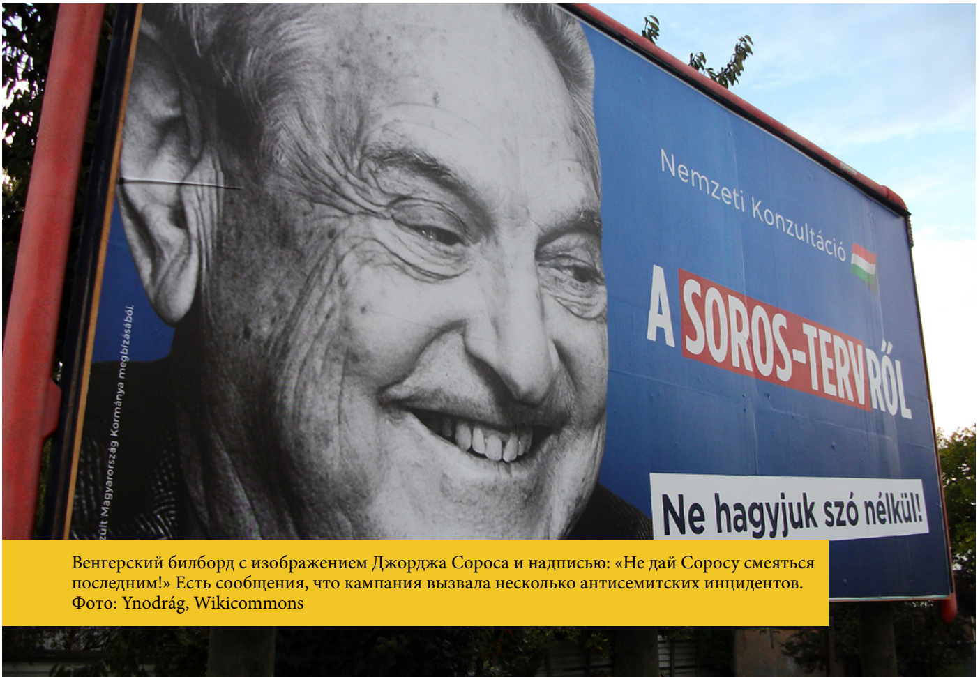
Венгерский билборд с изображением Джорджа Сороса и надписью: «Не дай Соросу смеяться последним!» Есть сообщения, что кампания вызвала несколько антисемитских инцидентов.

Антисоросовские настроения в Венгрии поспособствовали усилению и обычного антисемитизма. В июне 2017 года прошла массированная кампания против Сороса, официально предназначавшаяся для поддержки правительственной антимигрантской политики. Страну наводнили рекламные щиты, плакаты и телеролики, совокупная стоимость которых, по подсчетам, составляет около 21 миллиона долларов США, с изображением ухмыляющегося Сороса и надписью «Не дадим Соросу смеяться последним». Как сообщается, эта беспрецедентно персонализированное