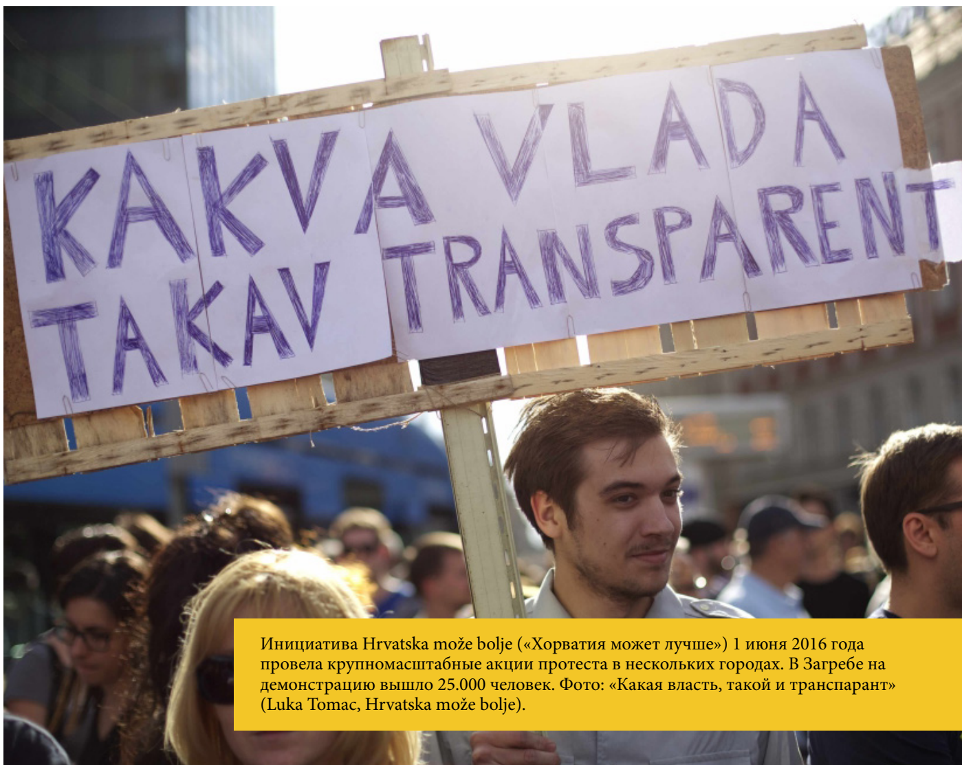
Инициатива Hrvatska može bolje («Хорватия может лучше») 1 июня 2016 года провела крупномасштабные акции протеста в нескольких городах. В Загребе на демонстрацию вышло 25.000 человек. Фото: «Какая власть, такой и транспарант».

начать громко утверждать, что каталог прав человека на равных основаниях включает обе категории прав» 120 .