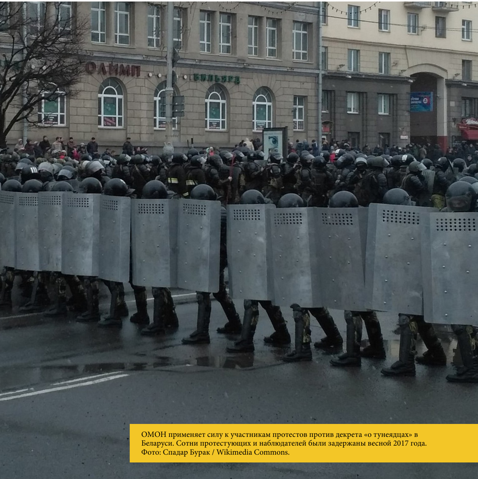
ОМОН применяет силу к участникам протестов против декрета «о тунеядцах» в Беларуси. Сотни протестующих и наблюдателей были задержаны весной 2017 года.